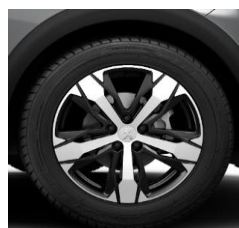
18" 'Los Angeles'