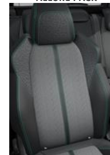
Tapicerka półskórzana Colyn Mistral