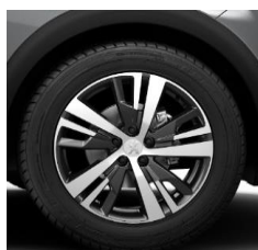
18" 'Detroit' Onyx Black