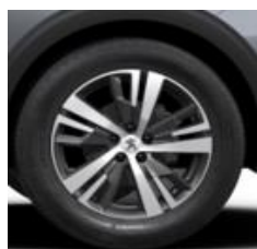
18" 'Detroit' Storm Grey