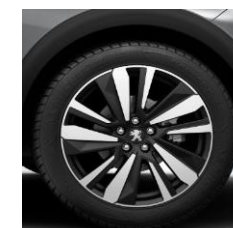
19" 'San Francisco'