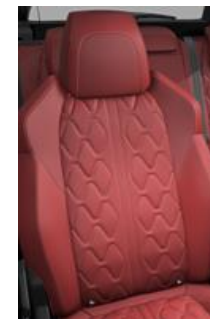
Tapicerka skórzana Nappa Rouge