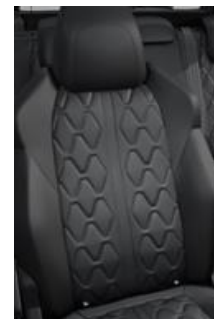
*Tapicerka skórzana Nappa Mistral