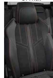
Tapicerka półskórzana Mistral + Alcantara