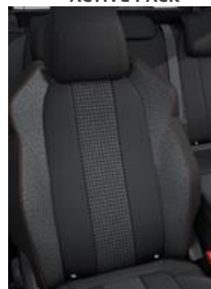
Tkanina Meco Mistral