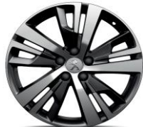
18" 'Detroit' Storm Grey