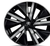
19" 'San Francisco'